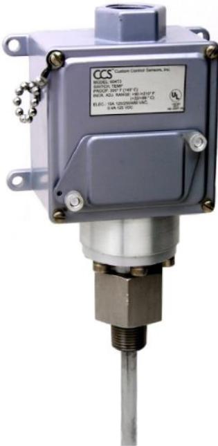
WAGA WYSYŁKOWA W PRZYBLIŻENIU 1843 g